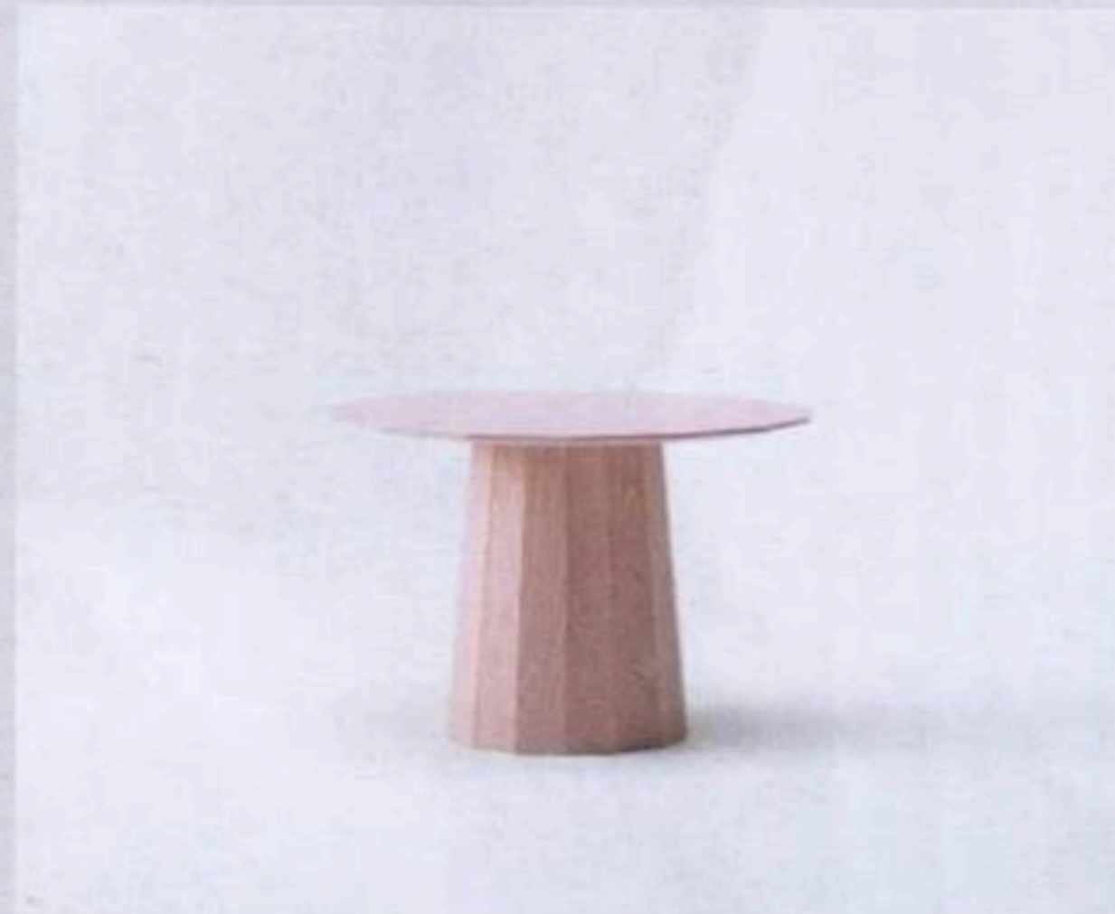
Color wood $7,400