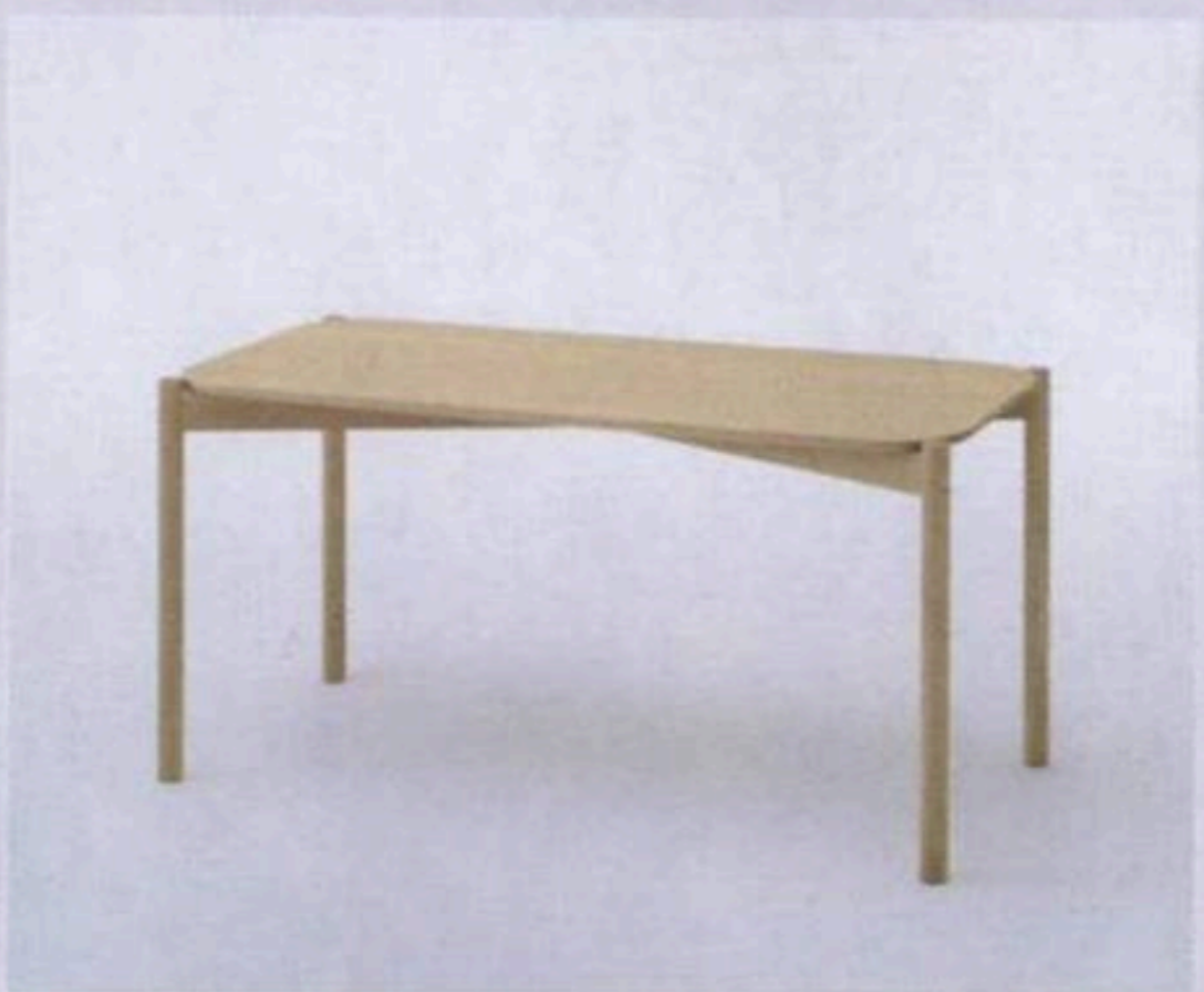
Castor table $12,700

OUT OF STOCK Playground_ 火炭坳背灣街 30 - 32 號華權工業中心 2 樓 0213 室 2858 2323