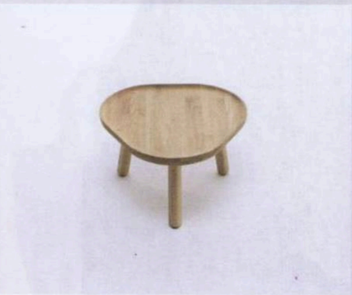
TAF chestnut $5,300