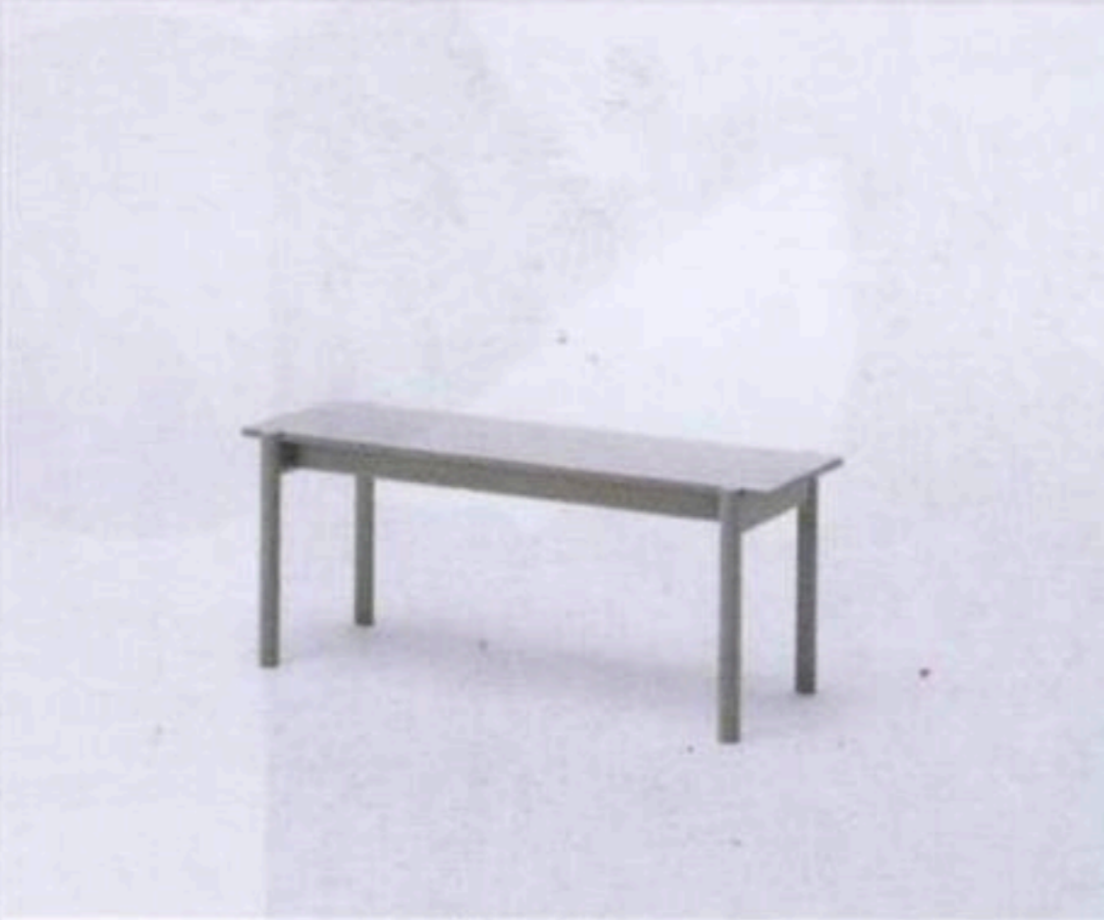
Castor bench $4,200