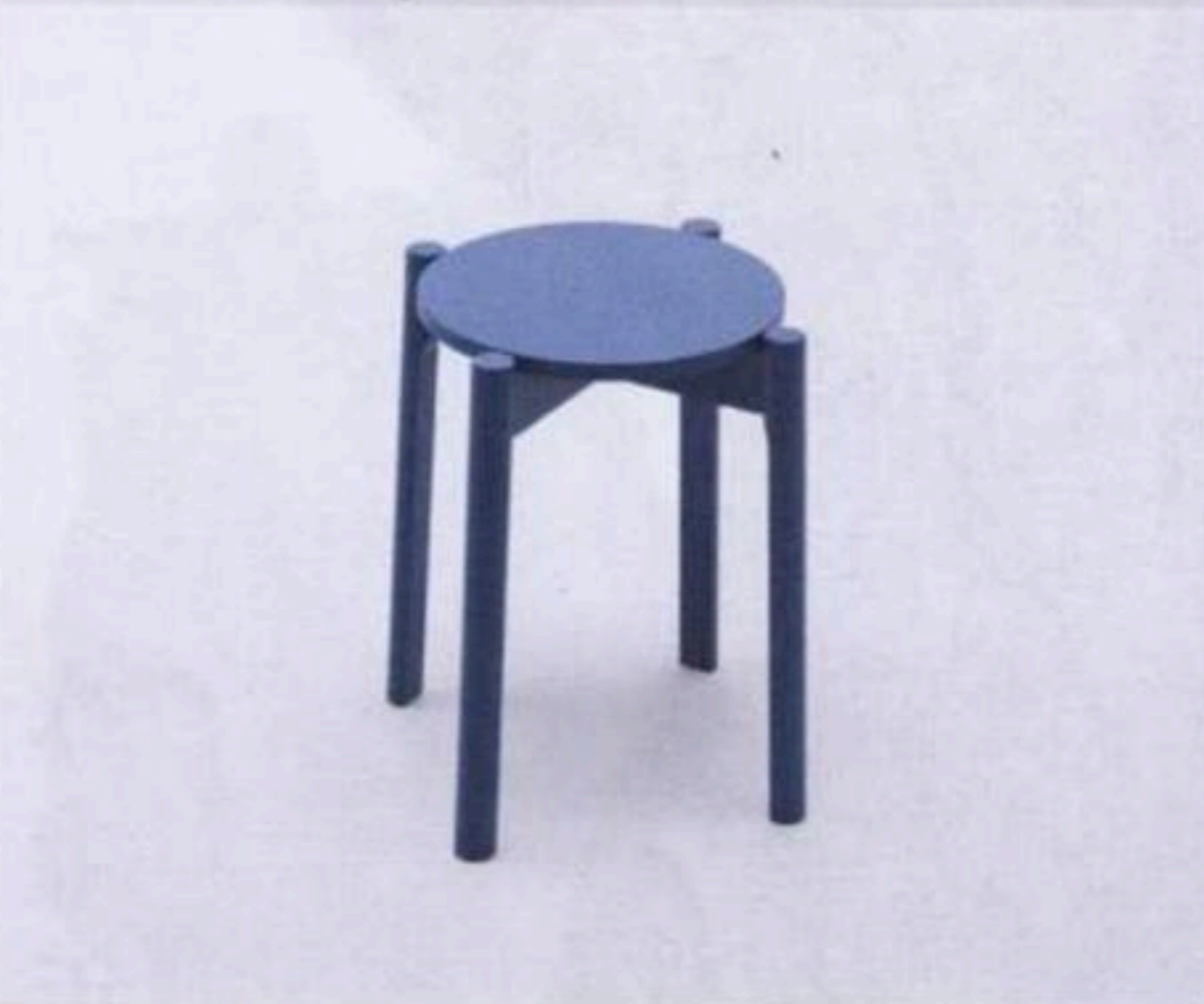
Castor stool $2,900