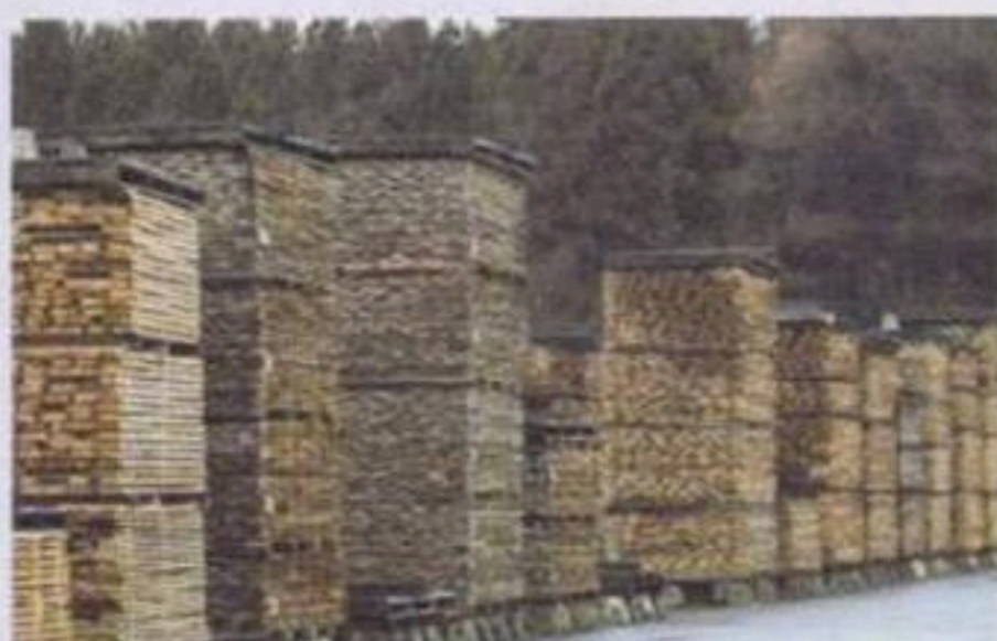
為防止木材被製成家具時會容易變形或裂開，KARIMOKU 會讓它們在工廠附近自然風乾三至六個月，令產品更耐用。

D: 例如木材處理和保存方面，KARIMOKU NEW STANDARD 的產品延續了 KARIMOKU 一貫的處理手法：為防止木材被製成家具時會容易變形或裂開，KARIMOKU 會讓它們在工廠附近自然風乾三至六個月，然後再作人工風乾程序，這點絕對是品牌的家具如此耐用的最大原因之一。