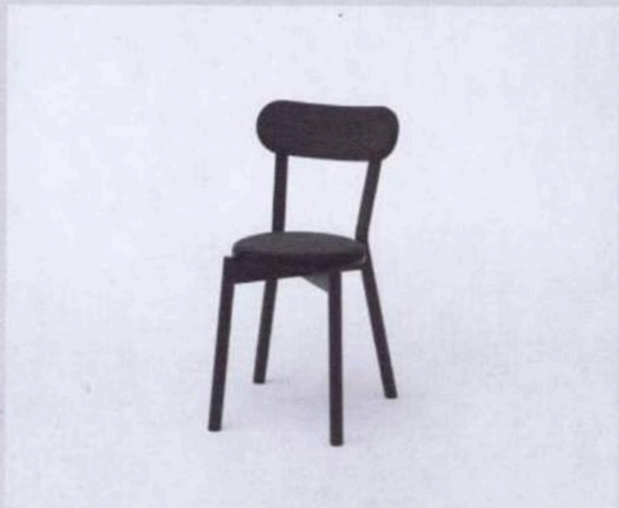
Castor chair $3,800